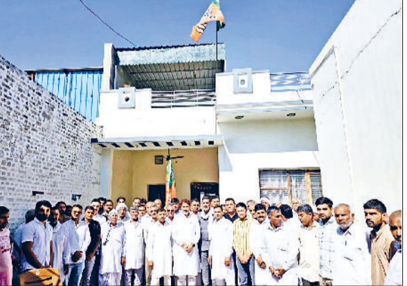
आत्मसात करें। उन्होंने कहा, संगठन की मजबूती ही देश की प्रगति का आधार है। प्रधानमंत्री नरेंद्र मोदी के नेतृत्व में देश निरंतर विकास की ओर अग्रसर है। हमारी प्रार्थमिकता गरीब, किसान, युवा और महिलाओं का कल्याण सुनिश्चित करना है। बृथ स्तर पर सक्रियता बढ़ाने पर जोर देते हुए सुभाष बराला ने कहा कि बृथ कार्यक्रमर्ता ही असल में संगठन की रीढ़ हैं। उनकी मेहनत और समर्पण से ही सरकार की योजनाएं समाज के

भारतीय जनता पार्टी के स्थापना दिवस के अवसर पर सोमवार को राज्यसभा सांसद सुभाष बराला ने अपने पैतृक गांव डांगरा, विधानसभा टोहणा में पार्टी का ध्वज फहराकर उत्सव की शुरुआत की। बृथ संख्या 148 पर आयोजित इस कार्यक्रम में सांसद ने कार्यक्रमकर्ताओं को संबोधित करते हुए संगठन की मजबूती और राष्ट्रसेवा का संकल्प दिलाया। सांसद सुभाष बराला ने कार्यक्रमकर्ताओं को संबोधित करते हुए कहा कि भाजपा का स्थापना दिवस केवल एक सांगठनिक उत्सव नहीं है, बल्कि यह राष्ट्रसेवा, संगठन के प्रति अटूट निष्ठा और जनकल्याण के संकल्प को दोहराने का तथ्य है। उन्होंने कहा कि पार्टी ने अपने सिद्धांतों और कार्यक्रमों के परिश्रम के बल पर ही आज देश की राजनीति में सबसे विश्वसनीय पहचान बनाई है। सांसद ने कार्यक्रमकर्ताओं से आह्वान किया कि वे 'राष्ट्र प्रथम' के मूल मंत्र को अपने जीवन में