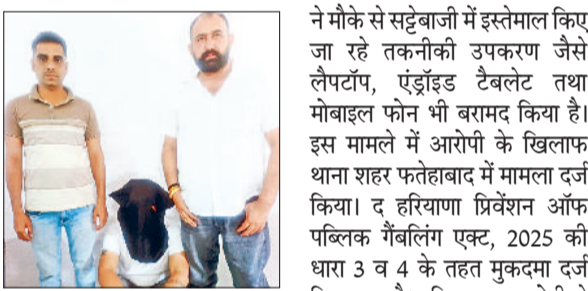
फतेहाबाद। क्रिकेट सट्टे के आरोपी में गिरफ्तार युवक।

सूर्या एन्क्लेव की गली नंबर 2 में एक मकान के अंदर चल रही थी अवैध बैटिंग