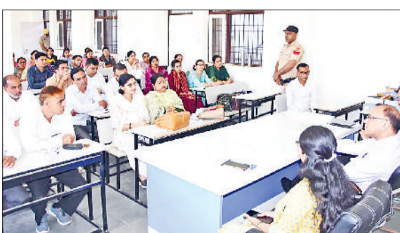
फतेहाबाद। जनगणना प्रशिक्षण में एन्यूमरेटर और सुपरवाइजर को निर्देश देते डीसी।

भारत की जनगणना-2027 के प्रथम चरण के अंतर्गत मकान सूचीकरण एवं गणना कार्य को लेकर सोमवार को डाइट मताना के सभागार में एन्यूमरेटर और सुपरवाइजर हेतु 3 दिवसीय प्रशिक्षण कार्यक्रम का शुभारंभ