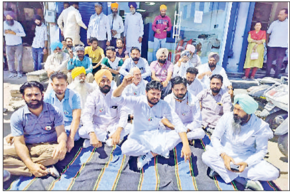
रतिया। गैस एजेंसी के बाहर धरना देते उपभोक्ता।

कई मामलों में तो खातों में सब्सिडी भी पहुंच गई है, जबकि हकीकत में सिलेंडर उपभोक्ता के घर तक पहुंचा ही नहीं। उपभोक्ताओं और किसान नेताओं ने आरोप लगाया कि स्टॉक होने के बावजूद सिलेंडर की कालाबाजारी की जा रही है। प्रदर्शन की सूचना मिलते ही फूड सप्लाय इंस्पेक्टर सुरेश कुमार मौके पर पहुंचे और गुरसाए लोगों को शांत करने का प्रयास किया। इंस्पेक्टर ने उपभोक्ताओं की समस्याओं को गंभीरता से सुना और उनकी लिखित शिकायतें लीं। उन्होंने आश्वासन दिया कि आपूर्ति व्यवस्था को दुरुस्त किया जाएगा और किसी भी उपभोक्ता को परेशानी नहीं होने दी जाएगी। इस ठोस आश्वासन के बाद उपभोक्ताओं ने अपना धरना समाप्त किया। उल्लेखनीय है कि रतिया में गैस किल्लत को लेकर पहले भी रोड जाम और नारेबाजी जैसी घटनाएं हो चुकी हैं। उपभोक्ताओं ने दो-दूक शब्दों में चेतावनी दी है कि यदि इस बार भी समस्या का समाधान केवल कागजों तक सीमित रहा, तो वे सभी किसानों और आम जनता को एकजुट कर एक बड़े और उग्र आंदोलन का आह्वान करेंगे।