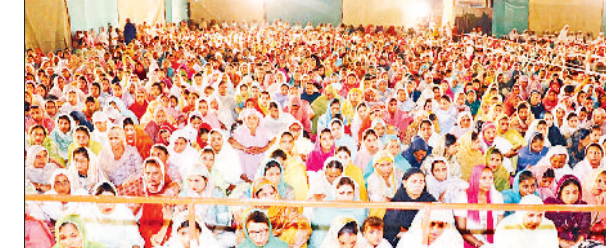
भूना। वार्षिक सत्संग समागम, संत वाणी से गूना कंबोज गुरुद्वारा परिसर।