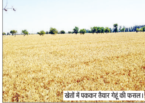
खेतों में पककर तैयार गेहूँ की फसल।

9 अप्रैल को हरियाणा के केवल उत्तरी जिलों पर असर रहेगा