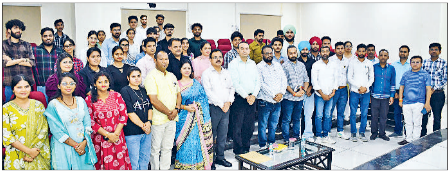
सिरसा। कार्यशाला में भाग लेते विद्यार्थी।