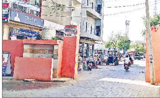
फतेहाबाद। अनाज मण्डी का मुख्य गेट।